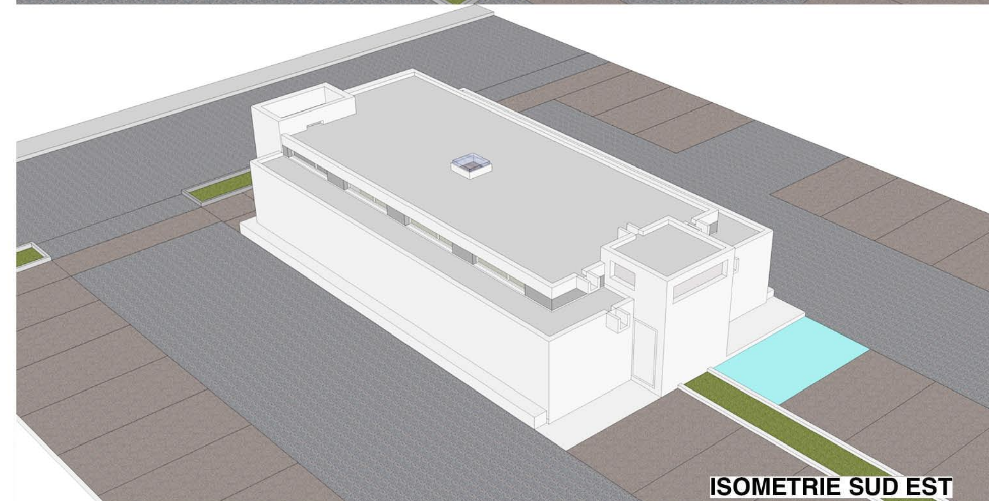
ISOMETRIE SUD EST