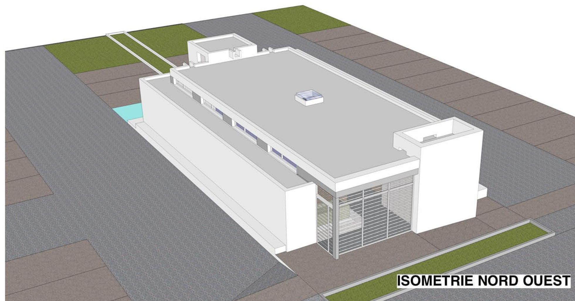
ISOMETRIE NORD OUEST