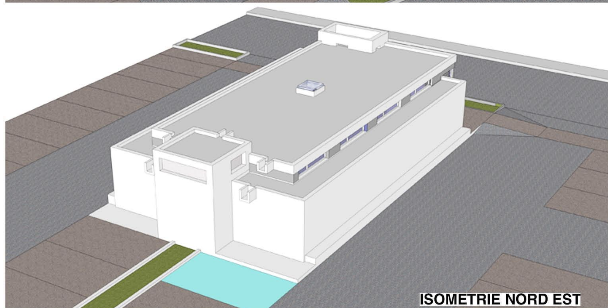
ISOMETRIE NORD EST